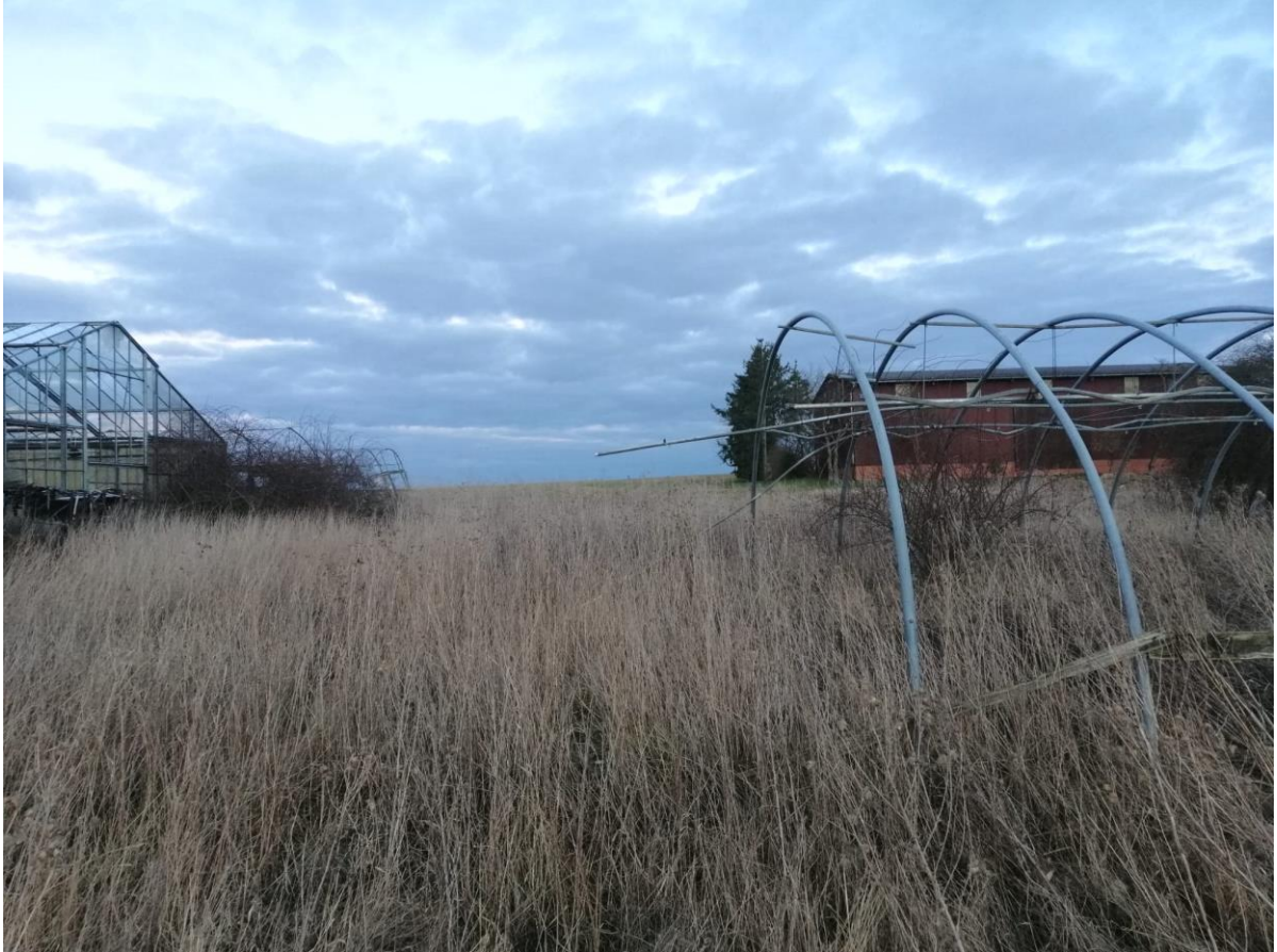
Abbildung 5 Blick auf das Gewächshaus im Südwesten des Gebiets