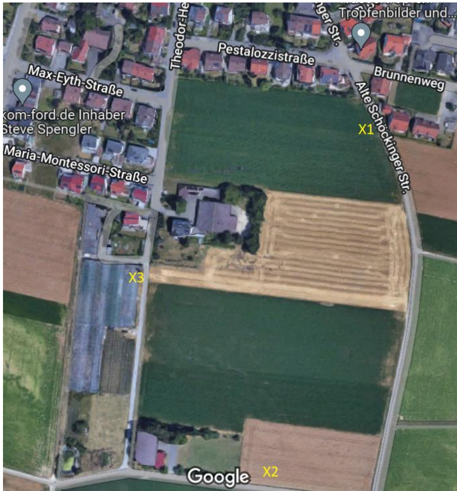
Abbildung 6 Standorte an denen die Klangattrappe abgespielt wurde

Bei jeder Begehung wurden nach Abspielen der Klangattrappe an verschiedenen Standpunkten entlang des Feldwegs Antworten von Rebhähnen verzeichnet. Auch ein Anfliegen eines Rebhahns wurde durch die Klangattrappe ausgelöst (daher wurde das Abspielen der Rebhuhnlaute sofort abgebrochen um ein Nachziehen oder Verscheuchen von Tieren zu vermeiden).