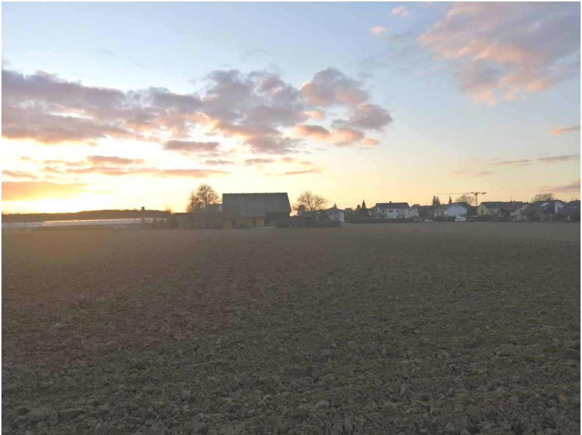
Abbildung 4 Blick auf den Hof auf dem Gebiet